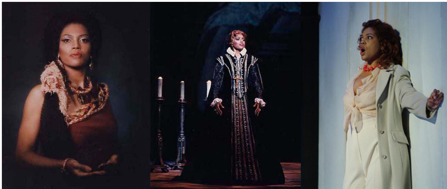
Аида – «Utah Opera